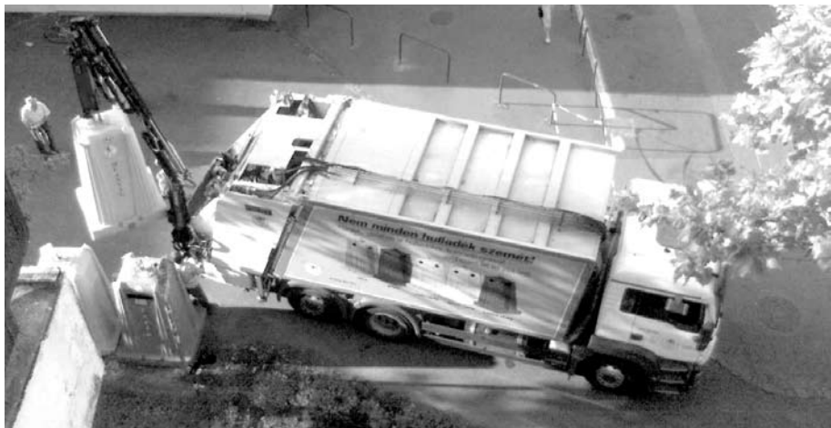
2007. július 18. szombat, hajnali 5 óra 30 perc, az FKF teherautója sípólva betolat a házak közé és hatalmas robajjal kiüríti a sárga konténereket. Ezután - ha ez egyáltalán lehetséges - még nagyobb zajjal összetömöríti a belé került műanyagpalackokat. Ezzel minden környékbelit felébreszt.

Kérdőívünkön lehetősége lesz jelezni azt is, ha szabadidejében hajlandó lenne egy kicsit segíteni nekünk.