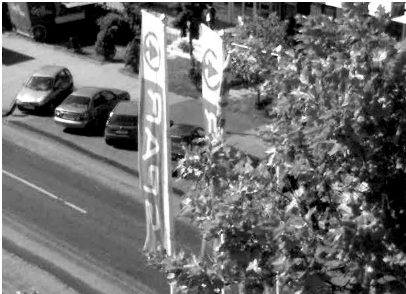
Az első Budapest Problémamegoldó Lakócsoport lapja