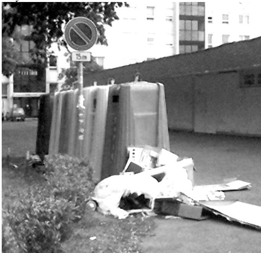
2007. május 11.- A Napfény utcai szelektív konténerek mellé lerakott kommunális hulladékhegy

Kipróbáltuk, az itt élő emberek semmivel sem ostobábbak, mint nyugaton élő társaik. Amikor pontos, érthető, elfogadható, és rokonszenves információt kapnak arról, mit kell tenniük a szelektív és nem szelektív szemetükkel, a kérésnek megfelelően járnak el. Miért? Mert bennük is ugyanaz merül fel, mint a legtöbb embertársunkban, ha értelmes kérést intézünk hozzájuk: „Jó nekem, jó a többieknek, jó a bolygónak. Miért ne cselekedhetnék helyesen?”