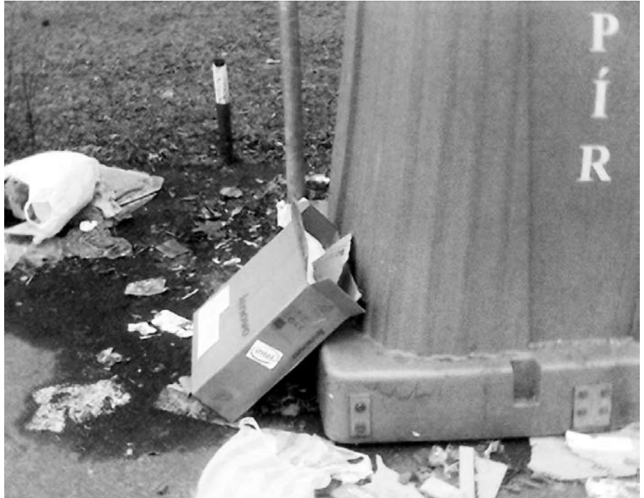
2007 bármelyik napja: A Napfény utcai szelektív konténerek környéke

I gy történt, hogy ez a cigarettázó ember megadta a legnagyobb segítséget, amit pillanatnyilag önkormányzati munkás adhat. Azt mondta: „fogjatok össze és azt csináljuk, amit mondotok.”