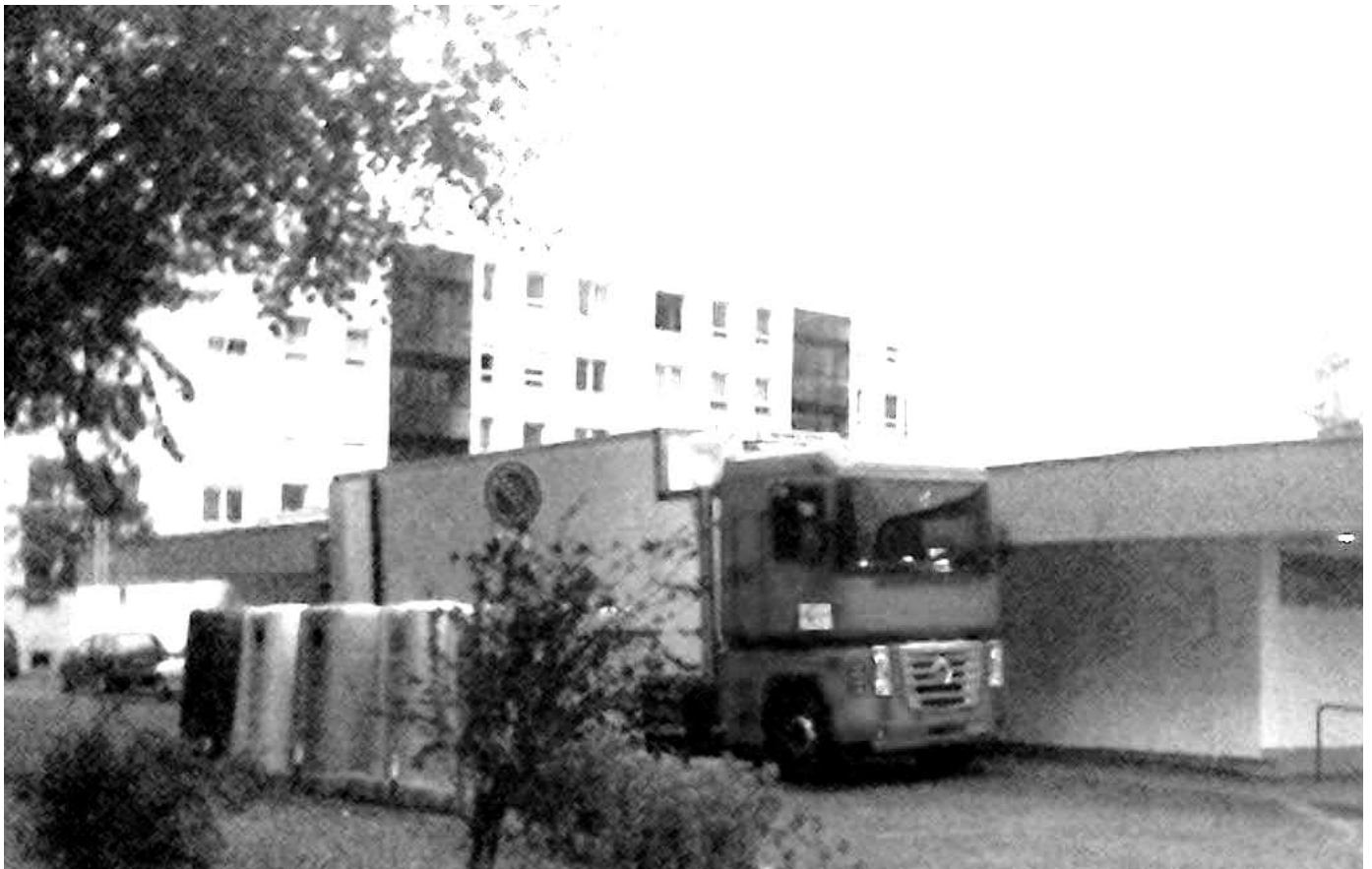
2007 augusztus 4. 19 óra 45 perc Spar hűtőkamion járó motorral és klímával pakol a Napfény utcában

Asztal mellett tárgyalni és okosan kérni. Erre a két szabályra és a lakókkal folytatott szoros együttműködésre alapozunk, amikor a sikereinket tervezgetjük. Reméljük, Ön is egyetért velünk ebben.